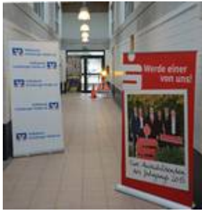
Aussteller in Trakt IV