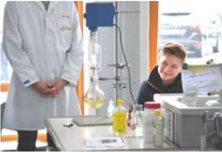
A&F Personalpartner GmbH