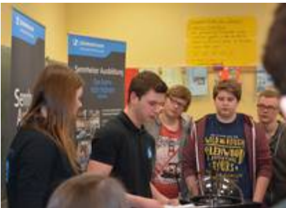
Sennheiser Electronic GmbH