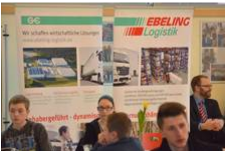
Georg Ebeling Spedition